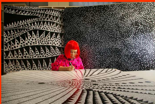
Yayoi Kusama signing an exhibit

Yayoi Kusama est une artiste contemporaine japonaise, avant-gardiste, peintre, sculptrice et écrivaine.