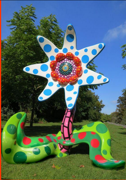
Flowers that bloom at midnight, 2012