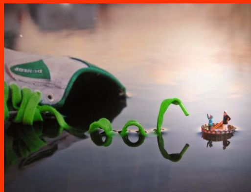
Linkachu, Little People , 2012