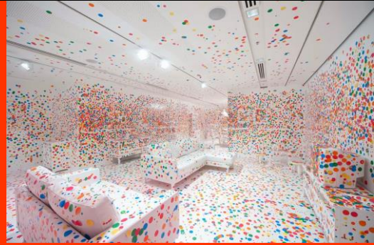
Réalisation des enfants/Collage de gommettes

A l'instar de Yayoï Kusama, utiliser le motif graphique comme matériau plastique pour transformer une maquette : Prévoir une maquette et/ou faire fabriquer la maquette d'une pièce toute blanche. Inventer un motif graphique. Répéter ce motif graphique sur toutes les surfaces visibles de la maquette. Ajouter des formes pour jouer sur l'échelle.