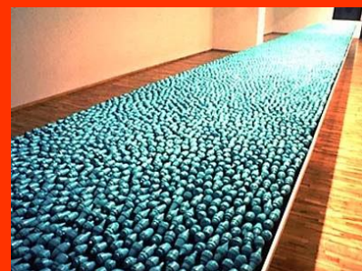
Mac COLLUM, Over Ten Thousand Individual Works , 1987