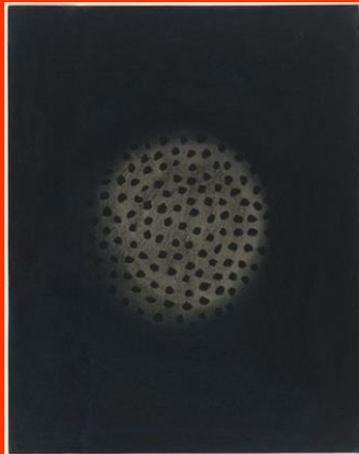
Sans titre, 1952