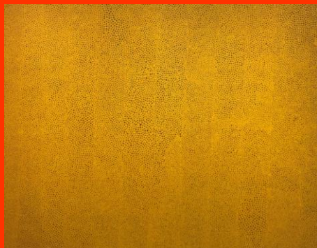
Infinity Nets Yellow, 1960

poutre, s'étendaient les formes des fleurettes rouges. Toute la pièce, tout mon corps, tout l'univers en étaient pleins ». Ces taches, ces pois, nourriront son concept de « self obliteration » et seront dès lors omniprésents dans ses œuvres et deviendront « outil visuel ».