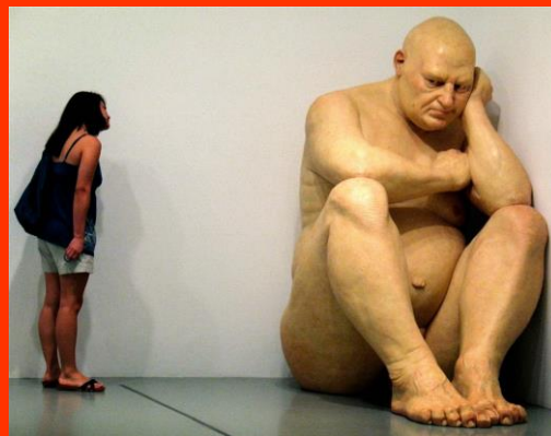
RON-MUECK, Géant , 2003