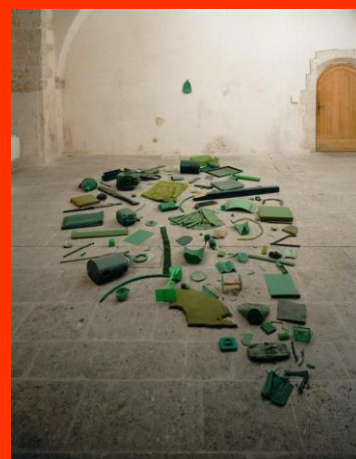
Tony CRAGG, Bouteille verte , 1980