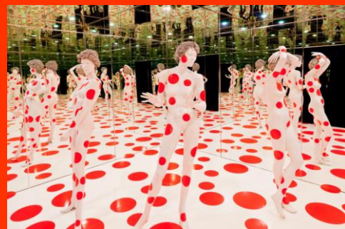
Yayoi KUSAMA, Repetitive vision , 1996