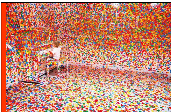
La pièce anéantie , 2012 Exposition « Look now See Forever » Galerie d'art moderne de Brisbane en Australie