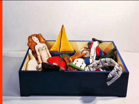
Claes OLDENBURG, Toy box , 1963

Inventez-lui un décor et une mise en scène pour le mettre en valeur. Travail en volume