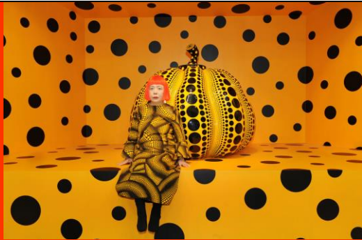
Kusama with Pumpkin, 2010