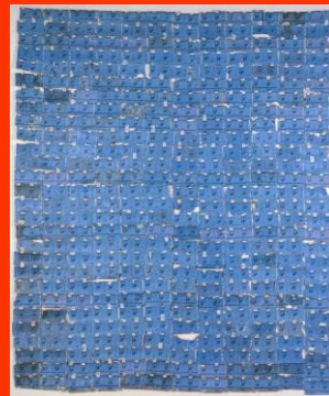
Pierre BURAGLIO, Assemblage de gauloises bleues , 1978