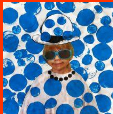
Empreintes d'objets circulaires