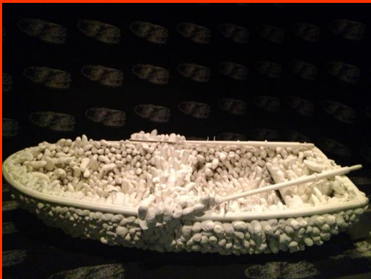
One Thousand Boats Show, 1963

exposées sous forme d'archives photos et vidéos. Elle collabore avec les artistes de l'avant-garde new-yorkaise : Jasper Johns, Yves Klein, Andy Warhol.