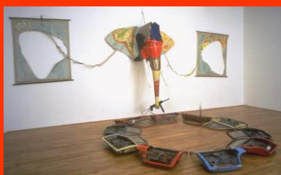
Bill woodrow, Elephant 1984

Une installation propose un ensemble d'éléments qui forment un tout adaptable à un lieu.