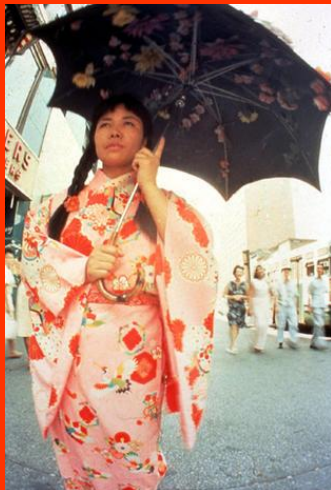
Walking Piece, 14th Street, 1966