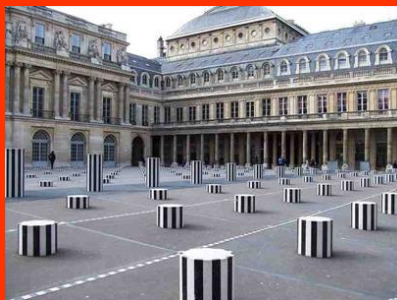
Daniel Buren, Les Deux Plateaux , 1982